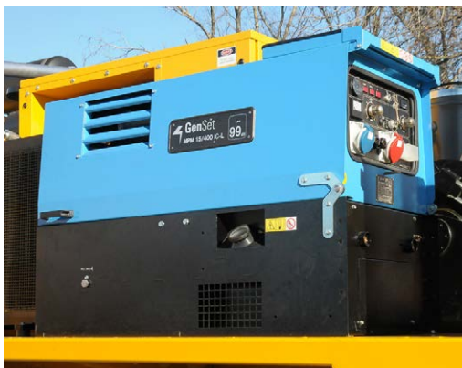
Saldatrice Welding machine Soudeuse Schweißer Soldadora