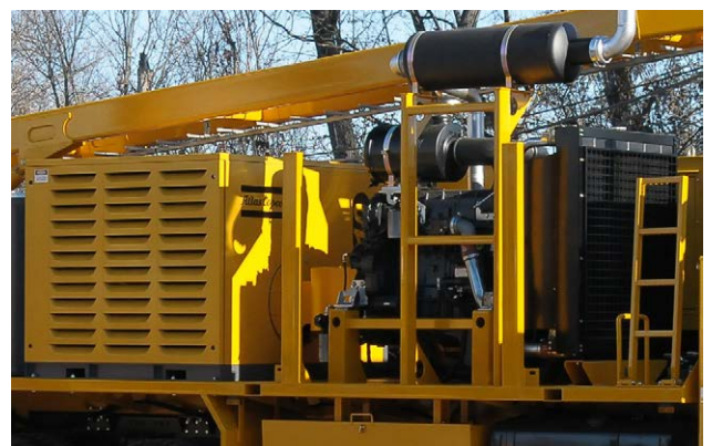
Compresore d'aria Air compressor Compresneur d'aire Kompressor Compresor de aire