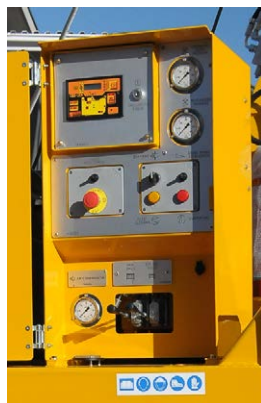
Pannello comandi Control panel Panneau de commande Bedienstand Panel de control